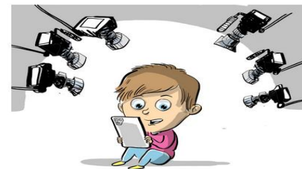
Анонимность в сети